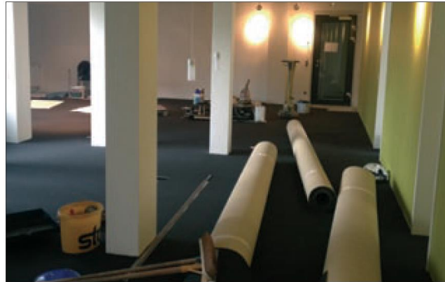
Es geht mit Hochdruck voran. Der Geschäftsstellenumbau zeigt seine Modernisierungsformen.

In zwei Bauabschnitten gegliedert, soll bis Mitte November 2012 die grundlegende Modernisierung und Umgestaltung der Büro- und neuen